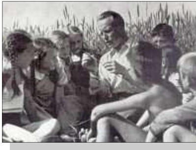
Der Reformpädagoge und Hochschullehrer Adolf Reichwein (1898-1944) im Kreise seiner Schüler

Der Schulträger Landkreis Gießen hat in die Gebäudesanierung und die Ausstattung der Adolf-Reichwein-Schule Pohlheim bereits viele Millionen Euro investiert. Weitere Sanierungen folgen.